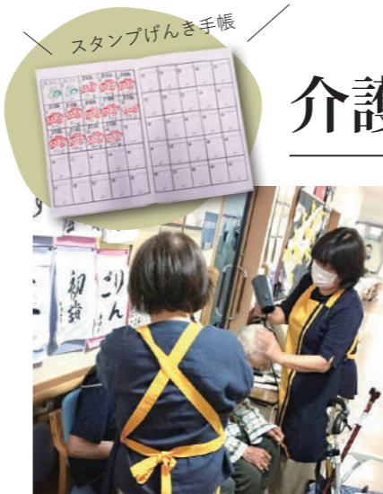
▲ 施設ボランティアの様子

「笑顔と感謝を忘れずに」この言葉を胸に、子どもや保護者に寄り添った温かい場所づくりができればと思っています。 スタッフ力を合わせて、子育て家族を応援していきます。